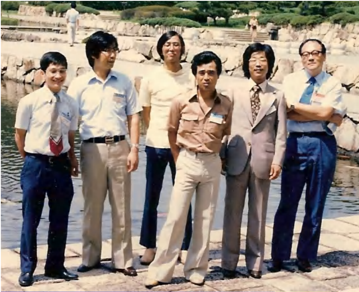
第16回宇宙線国際会議：京都 宝ヶ池国際会議場・新都ホテル 1979 Aug